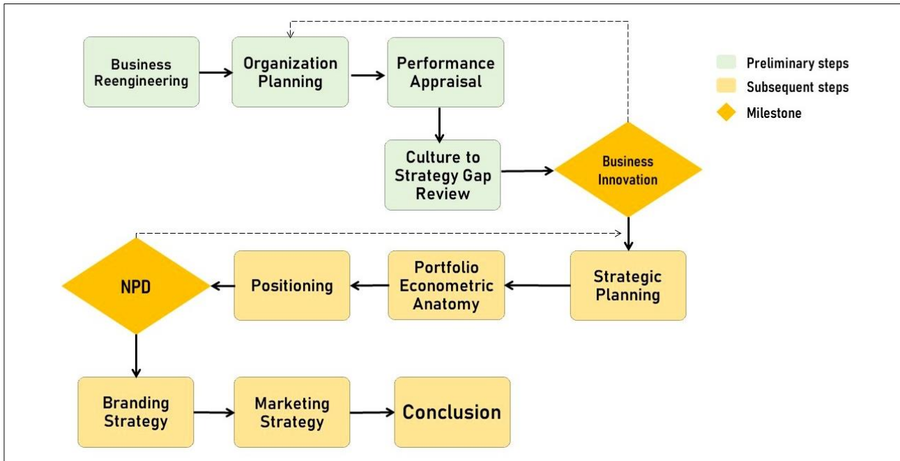
Σχήμα 4: Διάγραμμα Ροής Συμβουλευτικής Διοίκησης Two Milestones: Business Innovation, New Product Development (NPD) Two Phases: Preliminary, Subsequent