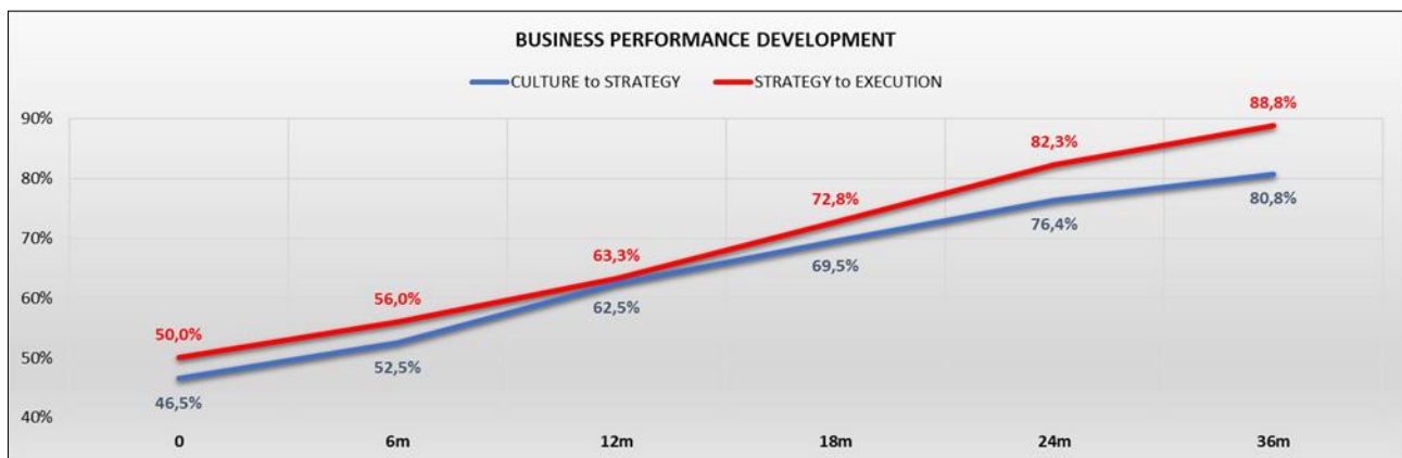
Σχήμα 6: Μεσοσταθμική Συγκριτική Διαχρονική Βελτίωση

Η ακολουθούμενη μεθοδολογία σε συνδυασμό με τις διορθωτικές ενέργειες που προκύπταν, βοήθησε σημαντικά τις επιχειρήσεις που αντιμετώπιζαν οργανωτική δυσλειτουργία, ανεπάρκεια διαχείρισης και αδυναμία γρήγορης επίλυσης προβλημάτων. Η εφαρμογή του, δημιούργησε ένα νέο σύστημα σύγχρονης επαγγελματικής διακυβέρνησης, που βελτίωσε την αποτελεσματικότητα και ενίσχυσε τους οικονομικούς δείκτες.