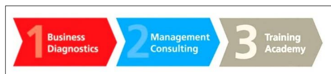
Σχήμα 2: Μεθοδολογία BMT 1-2-3