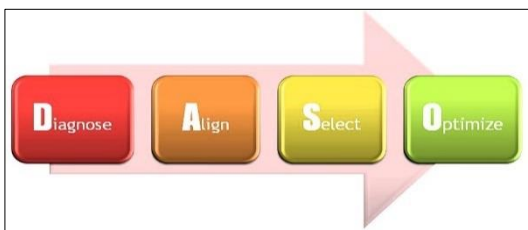
Σχήμα 1: Αρχή D.A.S.O.

Πάνω σε αυτούς τους άξονες, το νέο μοντέλο Στρατηγικής Διαχείρισης, βασίζεται στην αρχή D.A.S.O. ( D iagnose – A lign – S elect – O ptimize) και ακολουθεί τη μεθοδολογία BMT 1-2-3: Business Diagnostics – Management Consulting – Training Academy.